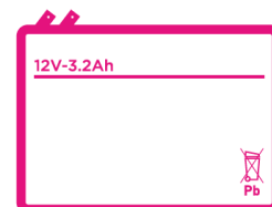
Batteries au plomb 2V à 12V