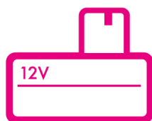
Petites batteries d'outillage électroportatif