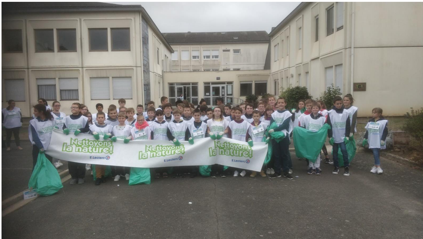
Les élèves de 6 ème et de SEES