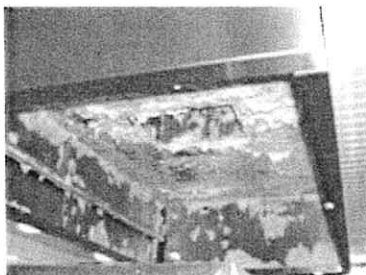
Dégraissage Canon Mousse