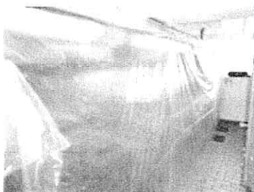
Protection des Installations

Les prestations auront lieu sur le site de : Restaurant ½ PENSION du collège