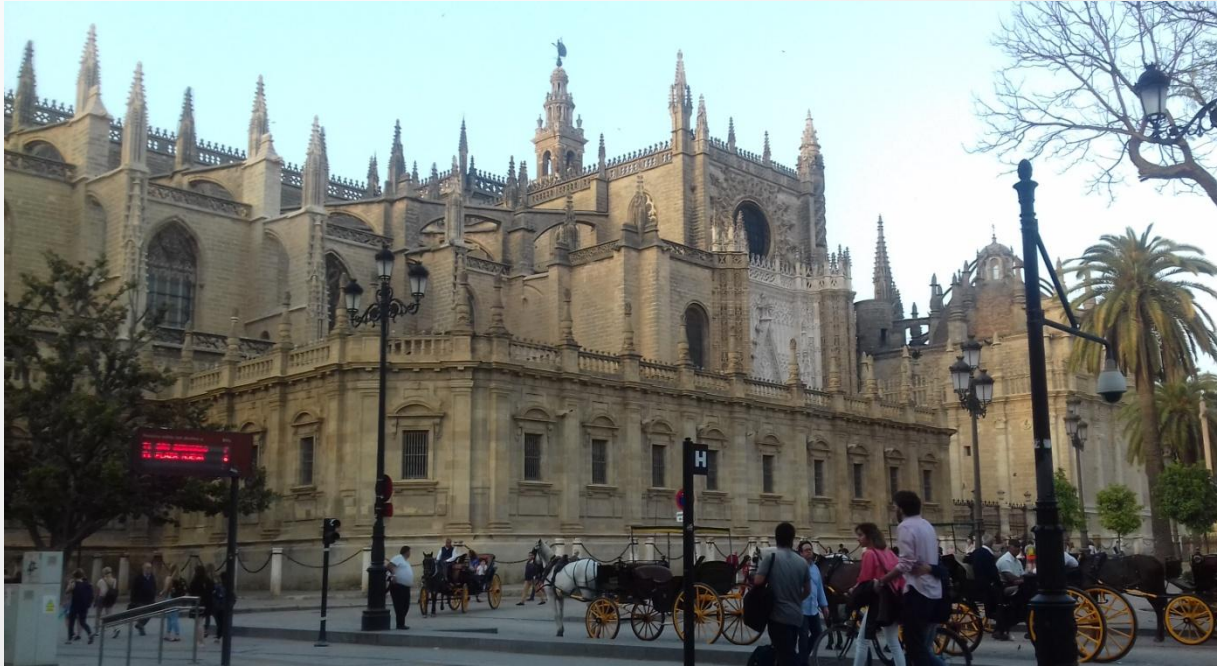
La cathédrale de Séville

Nous avons effectué une grande ballade dans les rues de Séville en passant par des monuments incontournables de la ville.