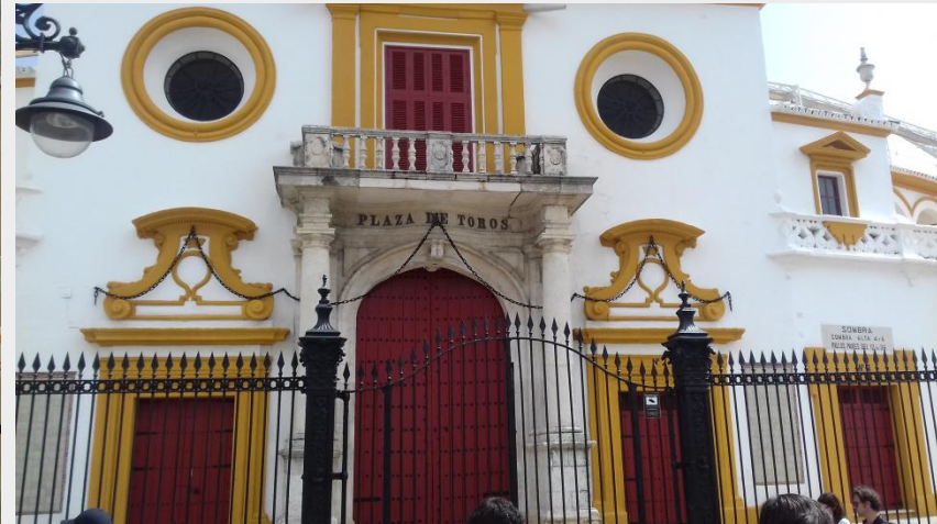
Les arènes de Séville