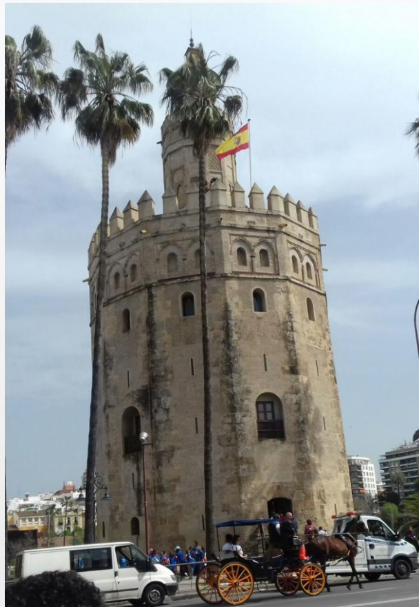
La tour d'Or

Nous avons poursuivi notre visite en passant par La tour d'or (Torre del Oro) et les célèbres arènes de Séville (la Maestranza).